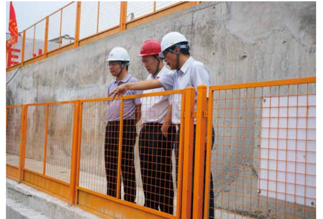
杭州市建委领导实地踏看项目施工情况

我司承建第二水源输水通道工程江南线过江段是整个项目的收官之战，过江段需两次穿越富春江，一次穿越浦阳江，六次穿越河道堤防，工艺采用6.2米口径泥水盾构长距离穿江掘进6.87公里，同时创下浙江省最长穿江盾构记录。